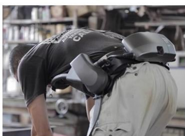
ユーピーアール社: 「サポートジャケット Ep+ROBO」